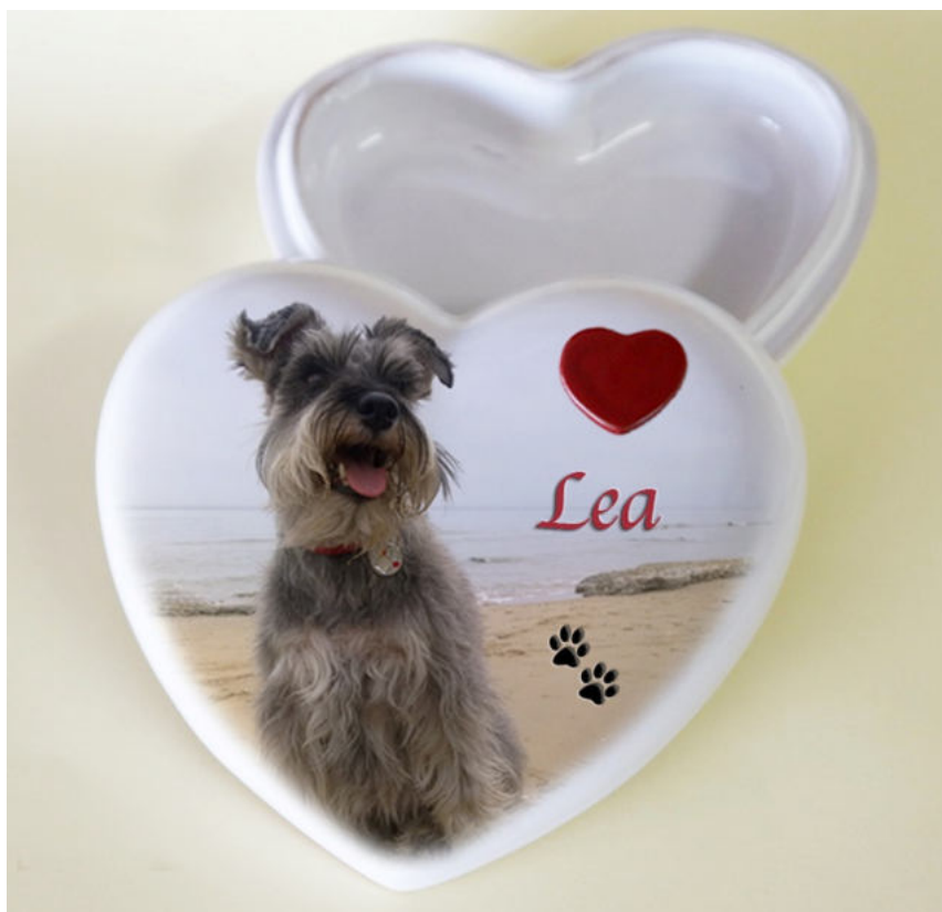
Modello CIN-001 CUORE

Manterranno per sempre la loro brillantezza, al riparo dal degrado del tempo, senza problemi di scoloritura da luce, sole o detersivi.