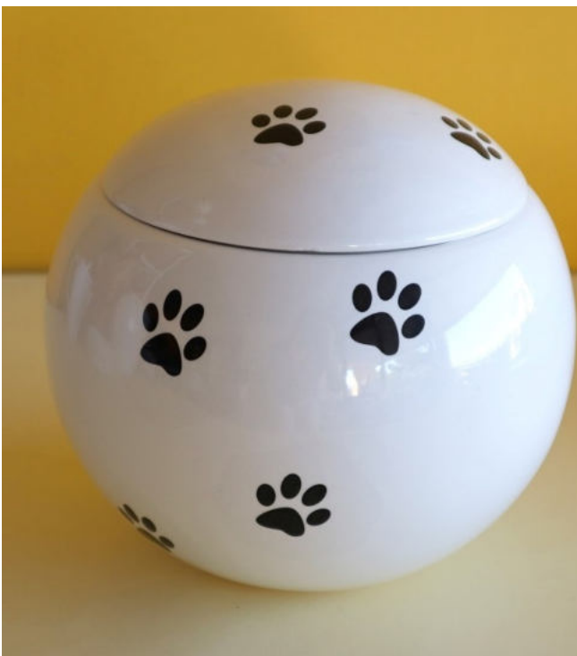
Decoro senza immagine

Peso Urna kg 0.700 circa Area di stampa h 10 circonferenza cm 50